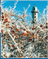
Warnemünde, Alter Strom